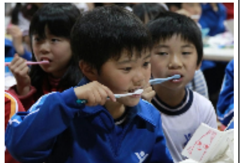
とう かあ いっしょ ただ は はぐき みが かた がくしゅう さん、お父さんやお母さんと一緒に正しい歯と歯茎の磨き方を学 習しました。