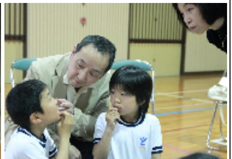
しかえいせいけんきゅうしょしかえいせいし はくち けんこうきょうしつ がっこうい ライオン歯科衛生研 究所 歯科衛生士さんの「歯と口の健康教室」で、学校医