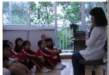
つき いったい だいさんもくようび じ ふん ふん よ き いただ 月に一回、第三木曜日8時15分から30分まで読み聞かせて頂いています。