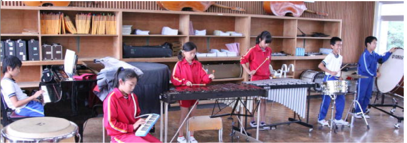
音楽の授業(6年生)。グループごとに素晴らしい演奏を聴かせてくれました。