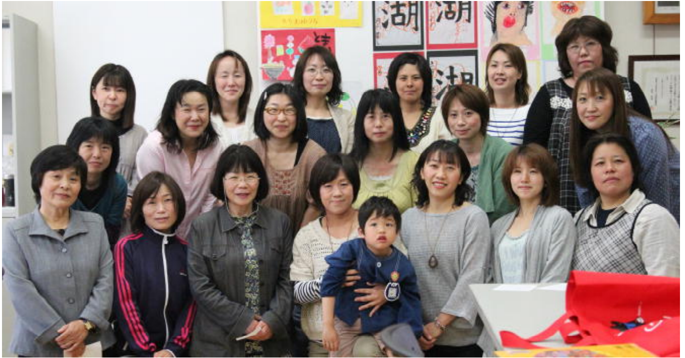
へいせい ねんど よ き かい こそだ ま さいちゆう かあ 平成24年度 読み聞かせの会のみなさん。 子育て真っ最中のお母さん、