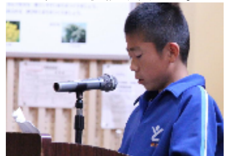
けんこういいん ねんせい せいかつ しせい はっぴょう がっこうほけん 健康委員の5、6年生が「生活リズムと姿勢」について発表した、学校保健