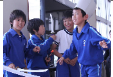
校長室に飾ってある子ども達の作品。フリースペースで寸劇を披露する5年生。