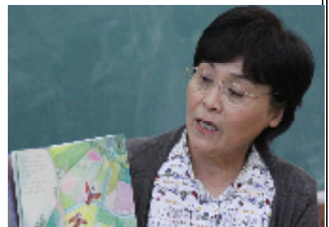
こそだ ひとだんらくつ かあ き いただ 子育てが一段落付いたお母さんなど、いろいろなみなさんに来て頂いています。