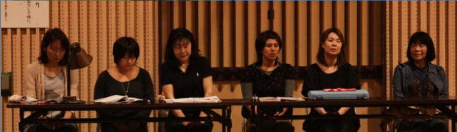
たいいくかん おおがた え じ ぜんこうよ き 体育館で、大型スクリーンに絵や字を写しだしておこなう全校読み聞かせ。