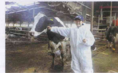
あかね動物クリニック