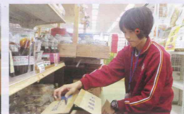
道の駅田原めつくはうす