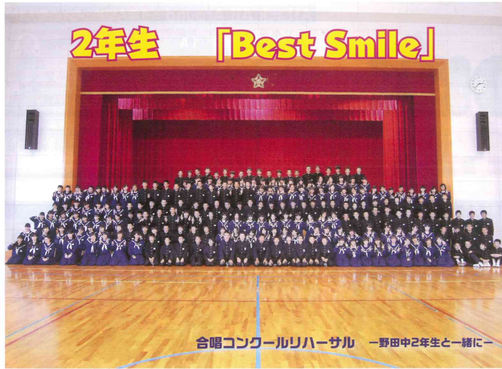
合唱コンクールリハーサル 一野中2年生と一緒に

親をこぼり 田原市立田原中学校 PTA広報委員会発行 印刷所 (有)太陽社印刷所