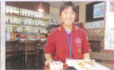
遊食ダイニング風雅